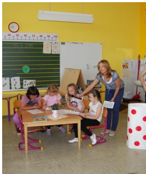
PREDSTAVITEV STROKOVNE KOMISIJE.