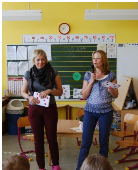
STROKOVNI DELAVKI V VLOGI VODITELJIC.